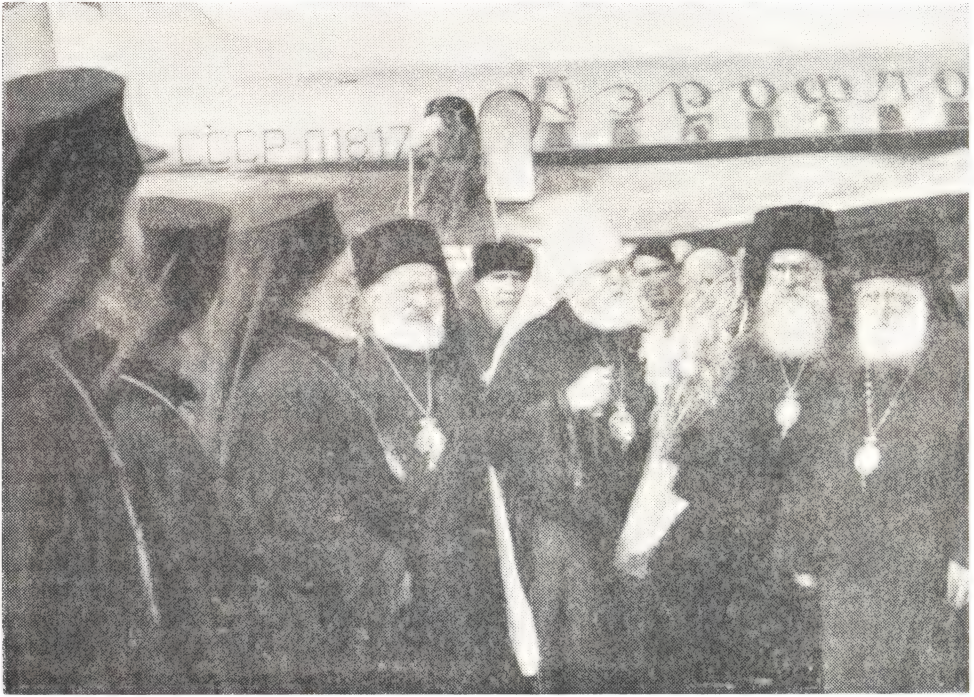
ВСТРЕЧА МИТРОПОЛИТА НИКОЛАЯ НА АЭРОДРОМЕ г. СОФИИ

его вступления на болгарскую землю и до самого отъезда. Он чувствовал, что оказанная ему любовь является любовью и к великой Русской Православной Церкви...»